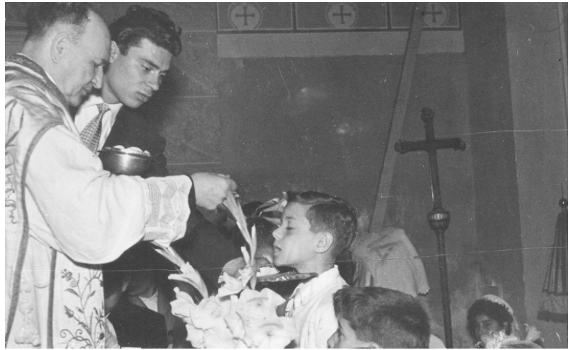
L'indimenticabile figura dell'Abate Gioffré

Ho appreso moltissimo in quel periodo che per me è stato formazione di una forte sensibilità. Avevo all'epoca due punti di riferimento che non smettevo di ammirare a bocca aperta: la statua del Cuore di Gesù nella Reale Abbazia e quella dell'Immacolata a Porelli. Era stupenda con quel manto azzurro e il volto di una dolcezza infinita.