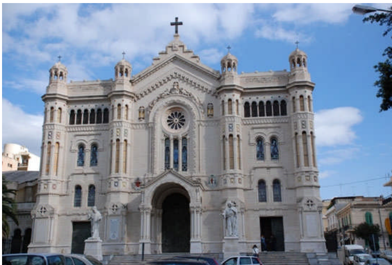
I locali a sinistra del Duomo di Reggio, facevano parte del vecchio Seminario Arcivescovile che ospitava noi novizi

Il Seminario Arcivescovile di Reggio era un'istituzione di prestigio e qualità con docenti estremamente preparati. In quella sede imparai il Galateo, il senso della disciplina e del rigore morale, lo stare assieme. Le nostre stagioni erano cadenzate dalle funzioni religiose: la Pasqua, il Natale, la Quaresima ecc. Le preghiere erano al mattino presto e il Vespro serale, durante il quale cantavamo i Salmi e gli inni gregoriani.