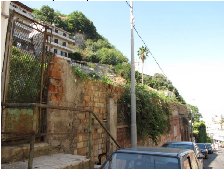
La vecchia e gloriosa sede dell'Azione Cattolica, in via Pietraliscia