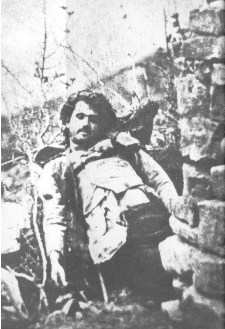
La morte di Nunzio Tamburrini