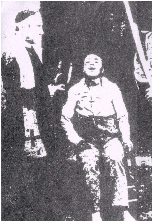
La fucilazione del “brigante” Curcio

La repressione scattò immediatamente e si dispiegò su larga scala.